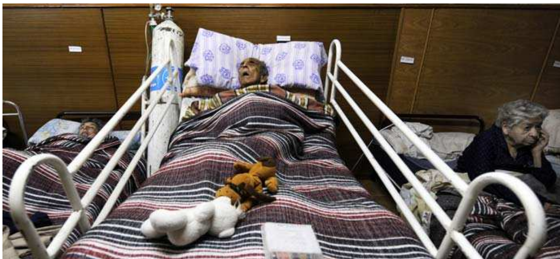
Los enfermos crónicos también lo han pasado mal.

Los Consulados de Madrid y Barcelona han trabajado, además, estrechamente con los Consulados Honorarios de Chile en España, los cuales han hecho una gran labor de apoyo a quienes lo han requerido. Asimismo destacan sus iniciativas con el fin de canalizar las ayudas ofrecidas por las distintas Comunidades Autónomas.