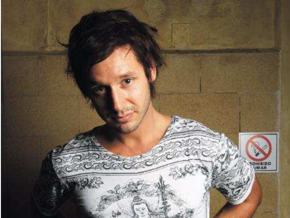
Benjamín Vicuña, actor chileno reconocido internacionalmente.

Diversos colectivos y asociaciones de chilenos, apoyados por el Consulado General de Chile en Madrid, trabajan para que este acto solidario sea potente.